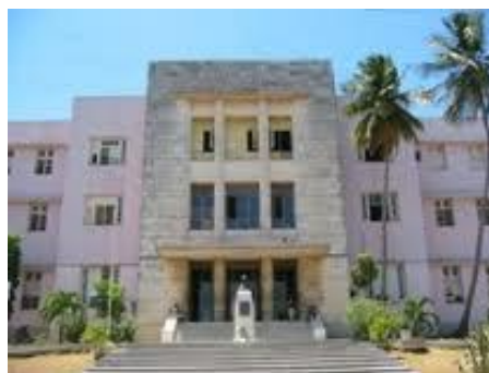
Fig. 1 - Hospital Clínico Quirúrgico “José Ramón López Tabrane”, de Matanzas.

Durante los años 70 y 80 se fundó el Servicio Provincial de angiología y cirugía vascular en Matanzas, ubicado en el centenario Hospital Clínico Quirúrgico “José Ramón López Tabrane” (fig. 1).