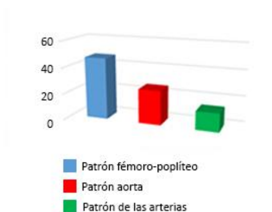
Fig. 1 - Distribución de los pacientes según el patrón esteno oclusivo.

En el examen físico vascular realizado se observó, desde el punto de vista topográfico, un predominio de la afección fémoro-poplítea (54,8%, n= 47) seguida de la aorta-ilíaco (29,9%, n= 26) y el de las arterias de la pierna (15,3%, n=14) (Fig.1).