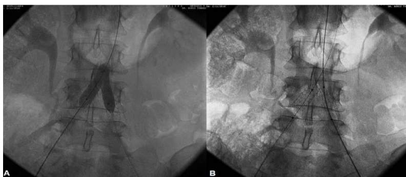
Fig. 1 - Angiografía por sustracción digital de la aorta abdominal y las arterias ilíacas comunes.

Nota: Se observa el catéter inflado (A) y desinflado con los stents autoexpandibles en posición (B).